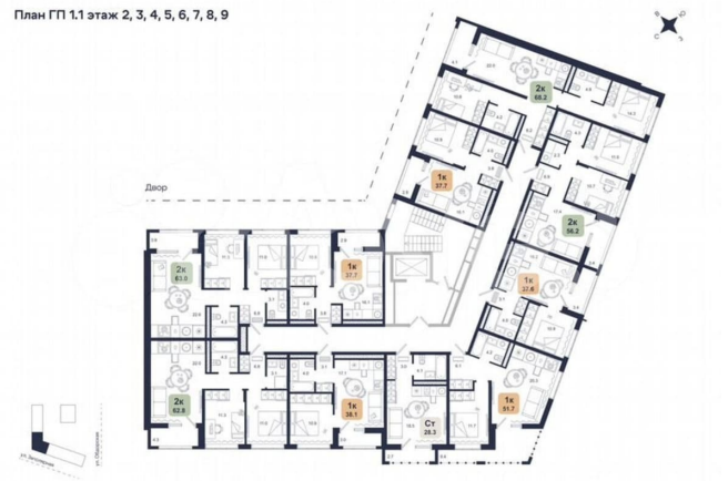
План ГП 1.1 этаж 2, 3, 4, 5, 6, 7, 8, 9