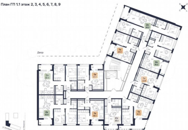
План ГП 1.1 этаж 2, 3, 4, 5, 6, 7, 8, 9

транспортные развязки, которые позволяют добраться в любую точку города за 15 минут. Архитектура комплекса выполнена с использованием современных приемов работы с ритмикой и представляет собой разноуровневую, сомасштабную человеку концепцию. Первая очередь расположена по ул. Заполярная/Обдорская и включает в себя два дома переменной этажности от 9 до 15 этажей. Внутри квартальной постройки появится пешеходный бульвар, где жители комплекса будут наслаждаться неспешными прогулками на свежем воздухе. Бульвар объединяет дома в закрытый квартал, в котором расположатся несколько детских и воркаут площадок, арт-объект, вольер для выгула кошек, стрит - бол, теннисная площадка и центральная площадь со своим амфитеатром. Во дворе нет машин. Это приватное пространство, попасть в которое могут только жители через Face ID. В «Августе» представлены планировки уникального формата с мастер-спальнями, гардеробными, постирочными и террасами. Квартиры сдаются в отделке white-box, а также с готовым ремонтом в двух вариантах.